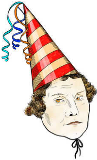
illustraties gemma pauwels